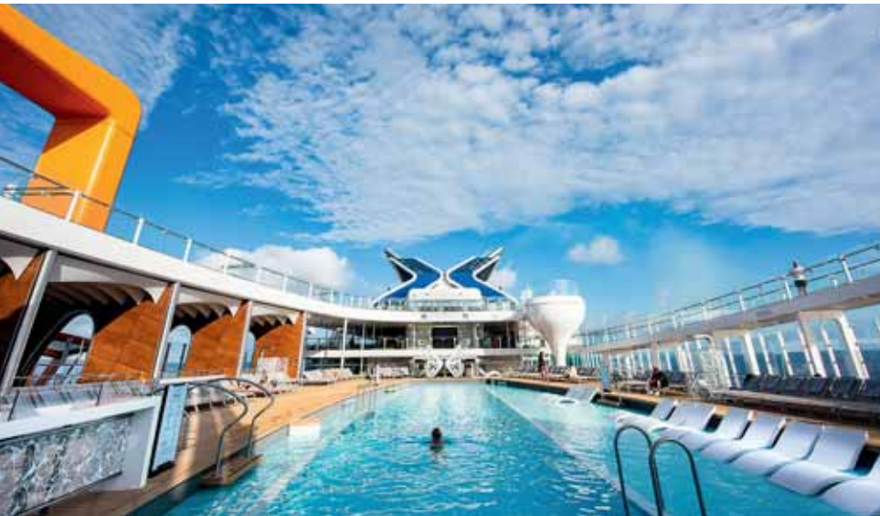
Das Resort-Deck der neuen Celebrity Edge ist weitläufig und großzügig gestaltet.

unsere Kunden auch immer die perfekte Verbindung zum Festland.