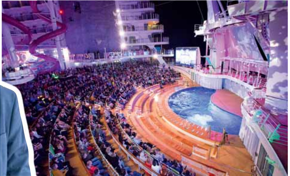
Das Aqua Theatre bietet ideale Präsentationsmöglichkeiten.

Zu Royal Caribbean gehören die drei Marken Royal Caribbean International, Celebrity Cruises und Azamara Club Cruises. Könnten Sie kurz erklären, was die einzelnen Marken ausmacht und wofür sie stehen?