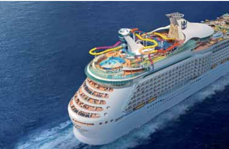
Die Navigator of the Seas bietet spannende Aktivitäten an Bord.