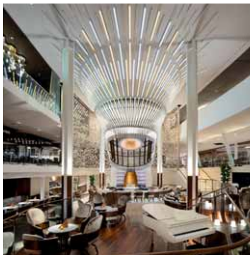
Das dreistöckige Grand Plaza stellt einen tollen Rahmen für Veranstaltungen dar.

Unsere Erfahrung ist, dass MICE-Projekte ein bis zwei Jahre vor dem Termin angefragt werden. Eine rechtzeitige Anfrage ist natürlich immer von Vorteil, um alle Möglichkeiten bestens anbieten zu können.