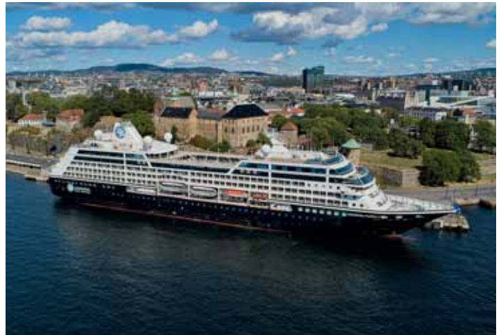
Azamara-Schiffe wie die Azamara Pursuit können ideal auch kleinere Häfen ansteuern.

← Theater, alles individuell bespiel- und anpassbar.