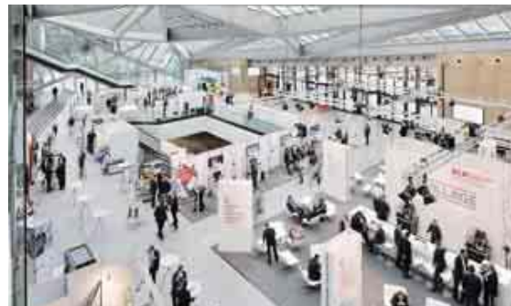
Mit seinen etwa 1.600 qm verfügt das Foyer des World Conference Center Bonn über viel Platz für Ausstellungen und zum Netzwerken.

Der helle Erweiterungsbau öffnet sich in der Eingangsebene zu einem weitläufigen Foyer, das von einem beeindruckenden Glasdach überspannt wird. Die aus rechteckigen Elementen gebildeten, dreieckigen Strukturen des Dachs offenbaren ein architektonisches Charakteristikum des Hauses: das Spiel mit geometrischen Figuren. In Kombination