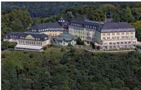
MICE auf dem legendären Petersberg – die 15 Veranstaltungsräume des Steigenberger Grandhotel Petersberg machen es möglich.

Weit über Bonn und dem Rheintal liegt der legendäre Petersberg mit dem Steigenberger Grandhotel Petersberg. Das Gästehaus der Bundesrepublik hat im Laufe der Jahre viele bekannte Persönlichkeiten wie Bill Clinton oder Nelson Mandela beherbergt und war Schauplatz internationaler Konferenzen wie der ersten Afghanistan-Konferenz 2001. Neben seinen 88 Zimmern und elf Suiten ist das Fünf-Sterne-Hotel vor allem auch für die edlen Veranstaltungsräume bekannt. Die 15 Säle können bis zu 500 Personen fassen und bieten atemberaubende Ausblicke auf die Umgebung.