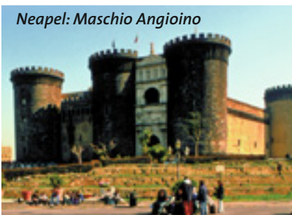
Neapel: Maschio Angioino