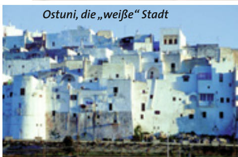
Ostuni, die „weiße“ Stadt

Die „Hacke“, wie Apulien wegen seiner geographischen Lage gerne genannt wird, befindet sich im Aufwind. In den Südosten Italiens kommt man nicht alle Tage, was die Region vor allem unter Incentive-Aspekten interessant macht. Passende Räumlichkeiten für Veranstaltungen unterschiedlichen Zuschnitts sowie direkte Erreichbarkeit per Flieger sind weitere wichtige Pluspunkte. Geographisch sollte man wissen, dass die von zwei Meeren – dem Adriatischen und dem Ionischen – umspülte Landschaft mit insgesamt achthundert Kilometern eine der längsten Küsten Italiens darstellt und das warme Mittelmeerklima mit ca. dreihundert echten Sonnentagen im Jahr eine ausgedehnte Freiluftsaaison erlaubt. Kulturell interessant: Viele Städte wie u. a. auch Bari gehörten einst zur „Magna Graecia“, einer alten Zivilisation, die lange vor den Römern begann. Heute sind sie neben ihrer ökonomischen Funktion als Wirtschaftszentren auch wichtige M.I.C.E-Standorte. Von Bari aus (rd. 320.000 Einwohner) lassen sich in jeweils gut einer Autostunde zwei UNESCO-Weltkulturerbestätten erreichen – das mysteriöse Castel del Monte sowie die Trullistadt Alberobello. In Bari selbst, das eine sich durch die gesamte Innenstadt schlängelnde Fußgängerzone besitzt, ist vor allem die hübsche Altstadt sehenswert, die auf einem Halbinselchen über dem Hafen thront und einen prominenten Mittelpunkt hat: Die stattliche Basilika San Nicola mit der Krypta des