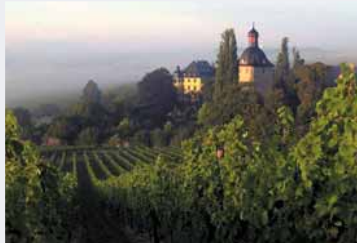
Rheingau: Mit der Rhein-Romantik begann im 18. Jh. der moderne Tourismus!

Wiesbaden ist das Tor zu einem der bekanntesten deutschen Weinbaugebiete – im westlichsten Vorort beginnt der Rheingau. Was liegt also näher, als diese schöne Landschaft zu erkunden? Zum Beispiel auf Schloss Vollrads: In den ehemaligen Privaträumen aus dem 17. und 18. Jh. lassen sich 3- oder 4-Gänge-Menüs mit begleitender Weinprobe und historischer Moderation inszenieren (ca. 3 Stunden, ab 20 Personen).